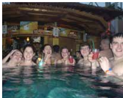
„Waschtag“ bei der Landjugend

Am 10. April fand der 4-er Cup in der Volksschule Maria Neustift statt. Dort durften jeweils 4-er Teams (2 weibliche und 2 männliche) der Lj aus dem Bezirk Steyr-Land ihr Wissen und Können unter Beweis stellen. Den ersten