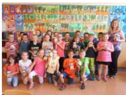
Köstliche Milchprodukte zum Weltmilchtag für Volksschule und Kindergarten

Dabei vermittelten wir den Kindern und Schülern viel Wissenswertes über das gesunde Nahrungsmittel Milch, die Produktion, verschiedene Verarbeitungsmöglichkeiten und es wurde ihnen auch einiges anschaulich erklärt. Die Kinder im Kindergarten gaben Rübenschnitzel ins Wasser und ließen sie aufquellen. Auch konnten sie an der mitgebrachten Silage und dem Heu riechen und bekamen somit einen kleinen Einblick in das Futter der Kühe. Gemeinsam schüttelten wir dann noch Schlagobers zu Butter und verkosteten diese auch gleich.