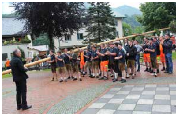
Übergabe des Maibaums an die Kleinreiflinger

Natürlich musste dieser wieder re-tour an die rechtmäßigen Besitzer, nämlich die Freiwillige Feuerwehr, gebracht werden. Dazu organisierte die JVP-Maria Neustift am 30. Mai einen Bus nach Kleinreifling.