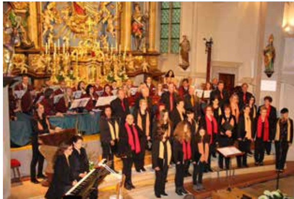
Konzert der Singgemeinschaft war ein großartiges Erlebnis

Ein herzliches DANKE an ALLE MITWIRKENDEN – ohne euch wäre diese Veranstaltung kein so