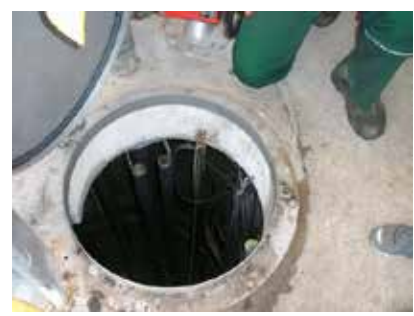
Spannende Einblicke in Bohrturm und Bohrloch