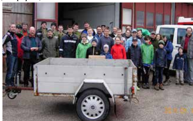
Viele fleißige Helfer bei „Hui statt pfui“