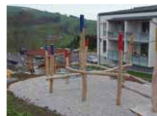
ÖVP Maria Neustift